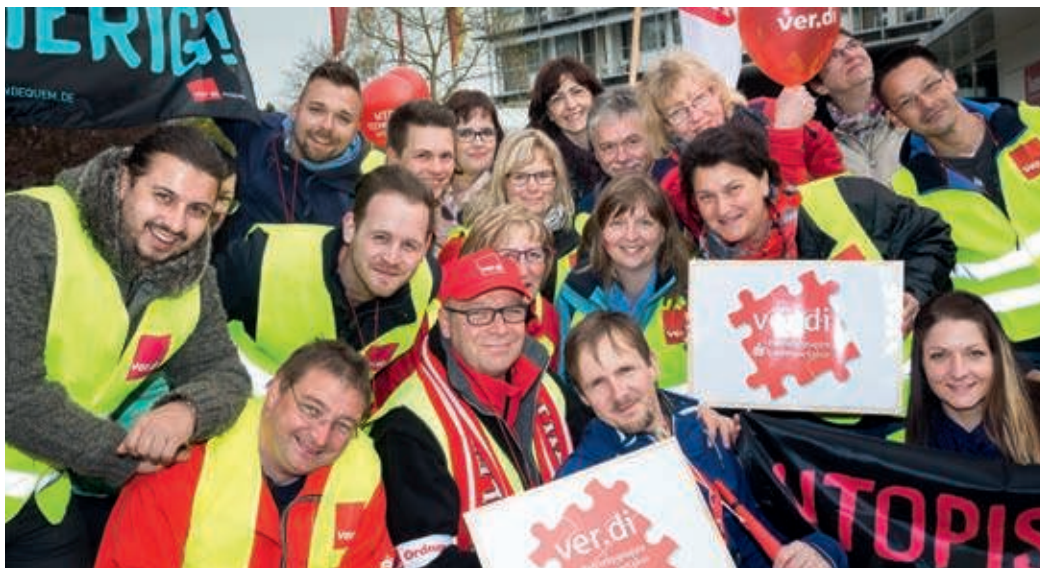
Kolleginnen und Kollegen demonstrieren vor Beginn der Verhandlungen in Potsdam für ihre Forderungen.