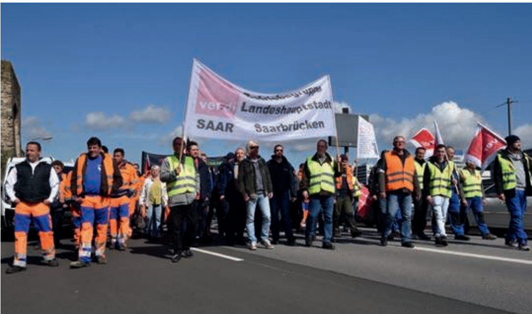
Warnstreiktag am 8. April 2016 in Saarbrücken – es müssen weitere Warnstreiks folgen.

www.troed.verdi.de www.mitgliedernetz.verdi.de